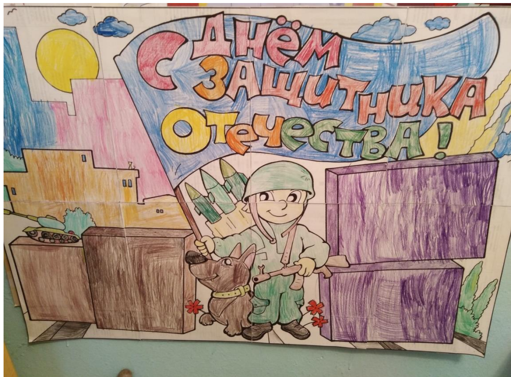
Стенгазета «Аты – баты, мы солдаты»