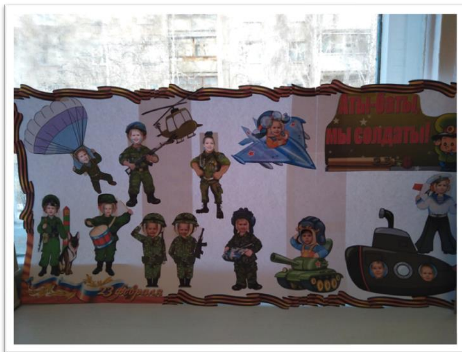
Папка – передвижка к празднику 23 февраля