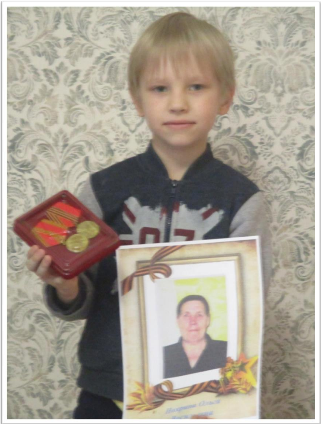
Рисунки, поделки детей.